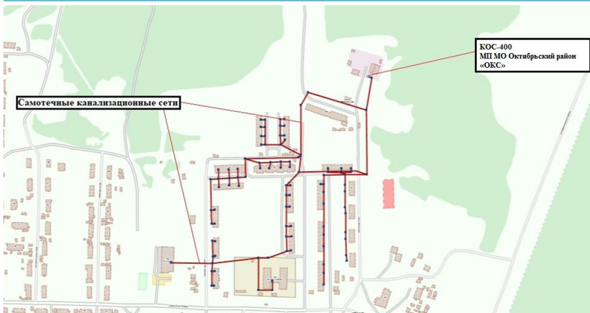
Рисунок 2.1.1.1 – Картосхема зоны действия ТЗ ВО с. Уньюган №1 и расположения входящих в нее объектов ЦС ВО