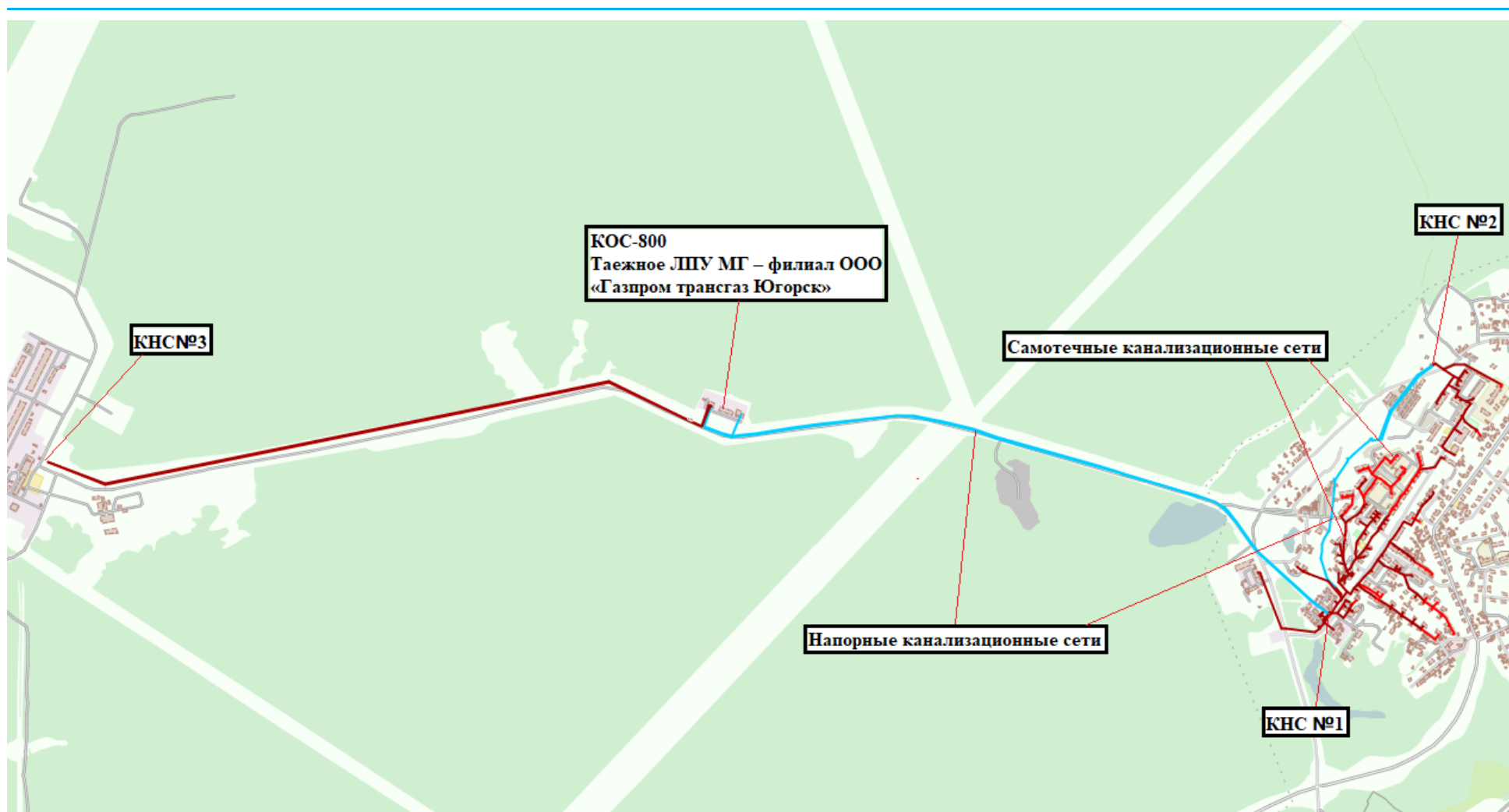
Рисунок 2.1.1.2 – Картосхема зоны действия ТЗ ВО с. Уньюган №2 и расположения входящих в нее объектов ЦС ВО