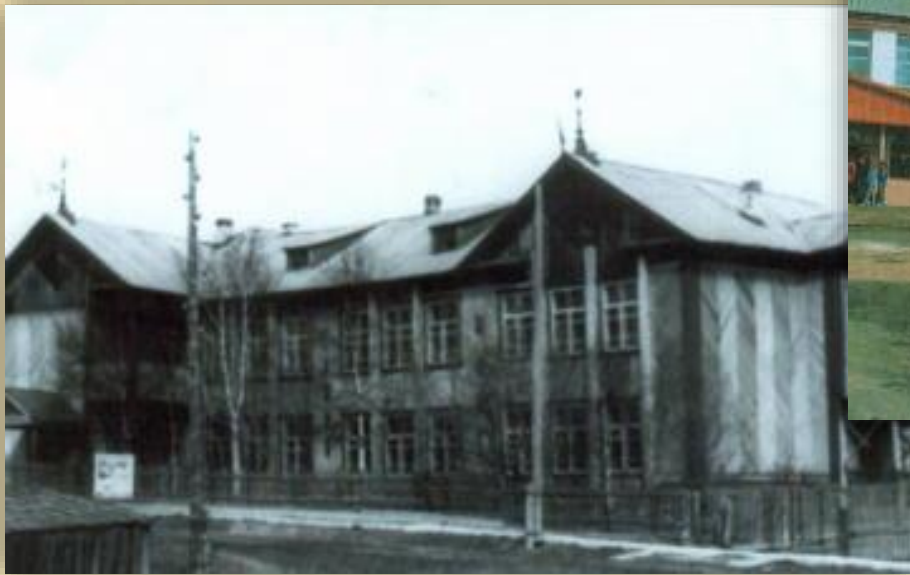
Общий вид здания Октябрьской школы в деревянном исполнении. п. Октябрьское. 1969 год.