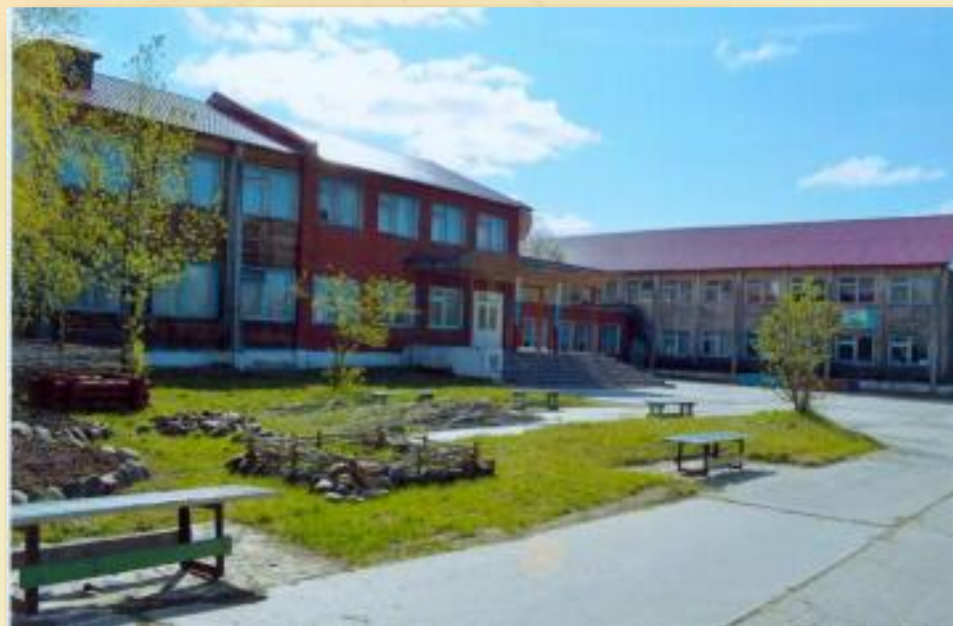
Общий вид здания Перегребинской средней общеобразовательной школы № 1. с. Перегребное. 01 июня 2015 года.

Архивный отдел администрации Октябрьского района. Фонд 82. Описание 2. Дело 12. Лист 10.