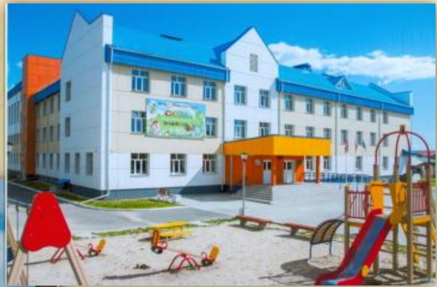
Общий вид здания Октябрьской средней общеобразовательной школы, расположенной по ул. Советская. п. Октябрьское. 11 августа 2017 года.

Архивный отдел администрации Октябрьского района. Фонд Фотодокументов. Описание 1. Дело 784.