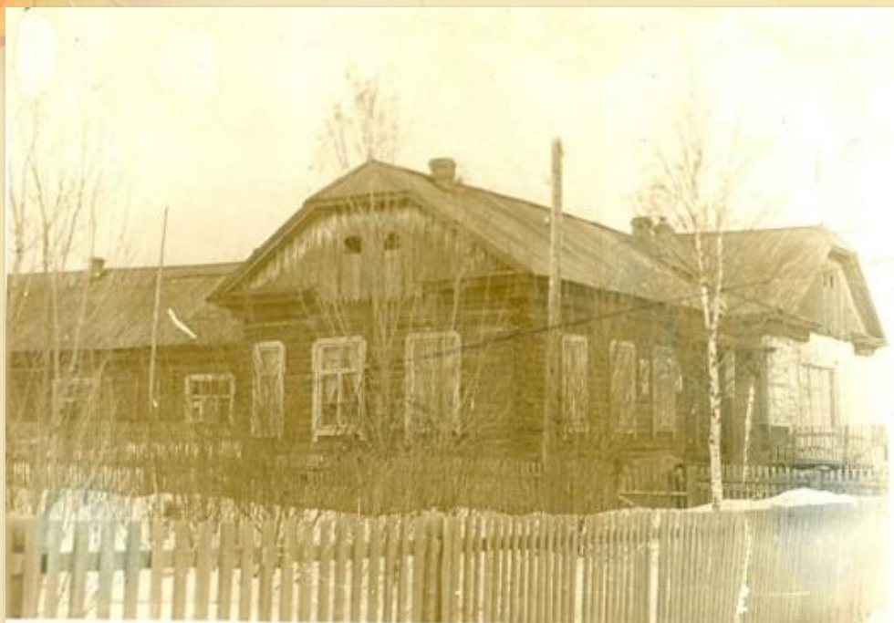
Общий вид здания Перегребинской школы. с. Перегребное. [1970-1980 годы].

Архивный отдел администрации Октябрьского района. Фонд 82. Описание 2. Дело 12. Лист 10.