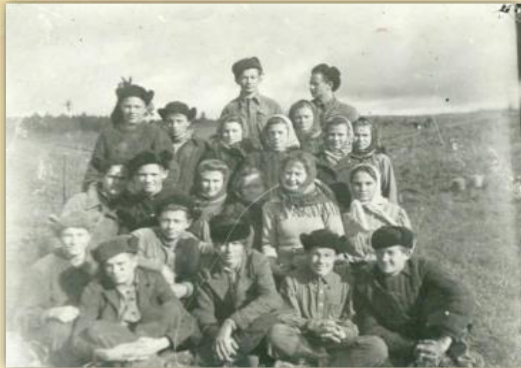
Ученики 10 класса Кондинской школы во время сбора картофеля на колхозном поле. п. Андра. 20 сентября 1953 года.

Архивный отдел администрации Октябрьского района. Фонд 82. Описание 2. Дело 12. Лист 6.