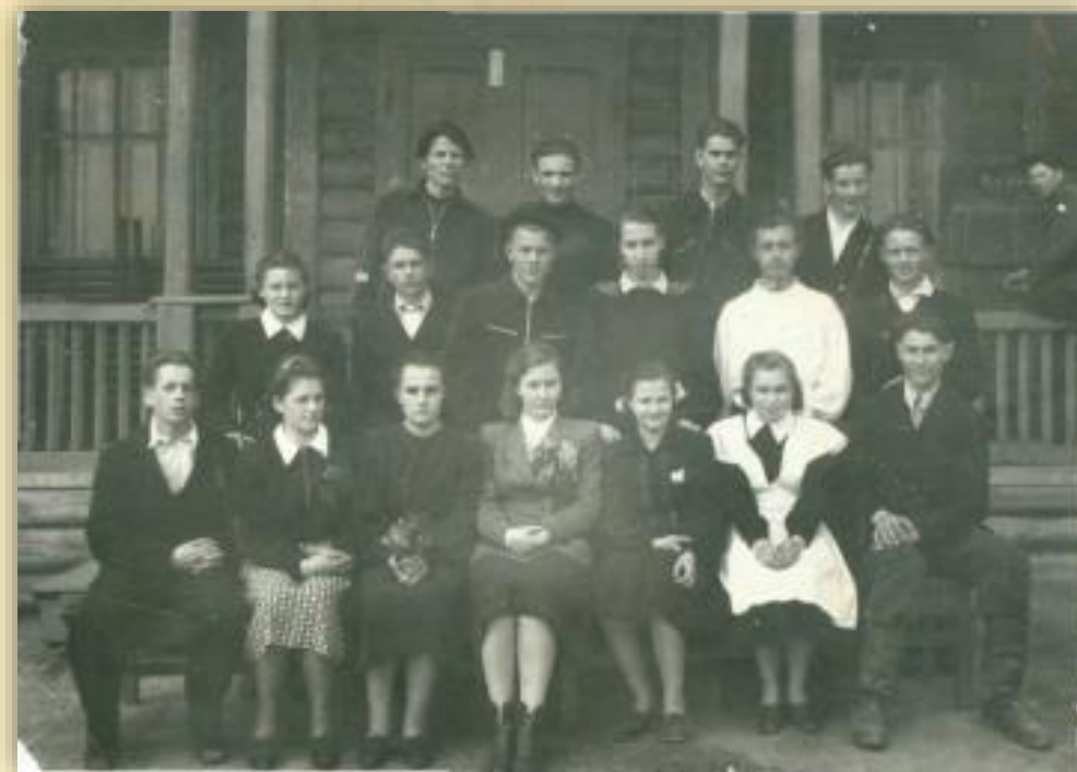
Выпускники Кондинской средней школы. с. Кондинское. 1954 год.