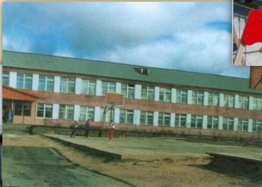
Общий вид здания Октябрьской средней общеобразовательной школы в кирпичном исполнении, расположенной по ул. Бичинева. п. Октябрьское. Весна 2005 года.