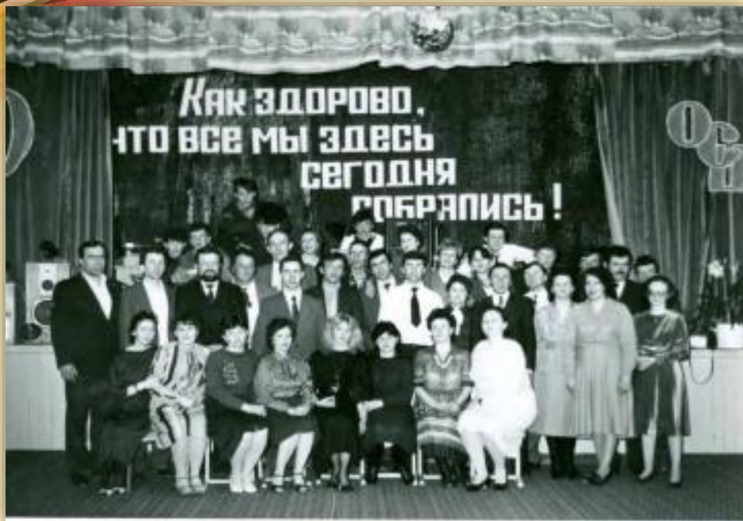
Учителя и гости на вечере встречи выпускников во время празднования 50-летия Октябрьской школы. п. Октябрьское. 6 февраля 1988 года.